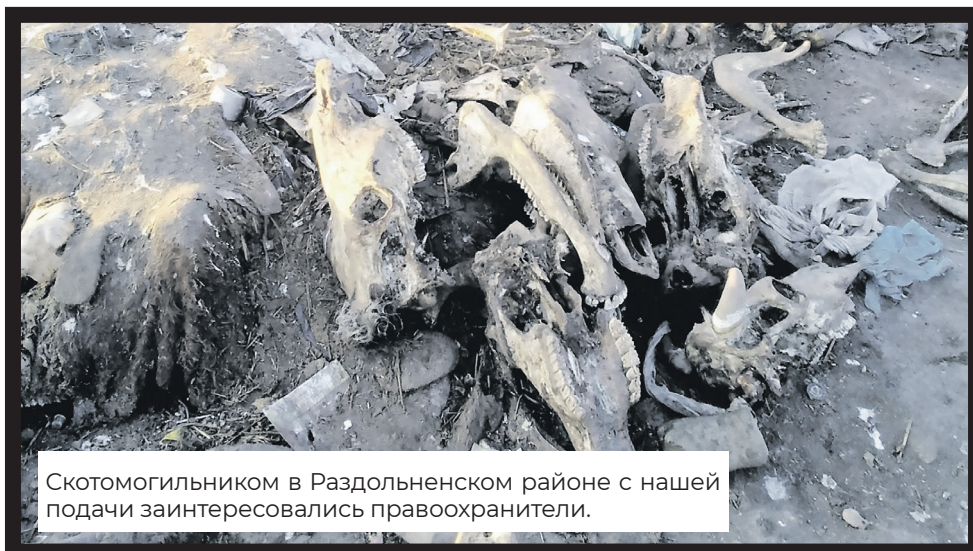
Скотомогильником в Раздольненском районе с нашей подачи заинтересовались правоохранители.

Проект Крымского регионального отделения партии СПРАВЕДЛИВАЯ РОССИЯ — ЗА ПРАВДУ