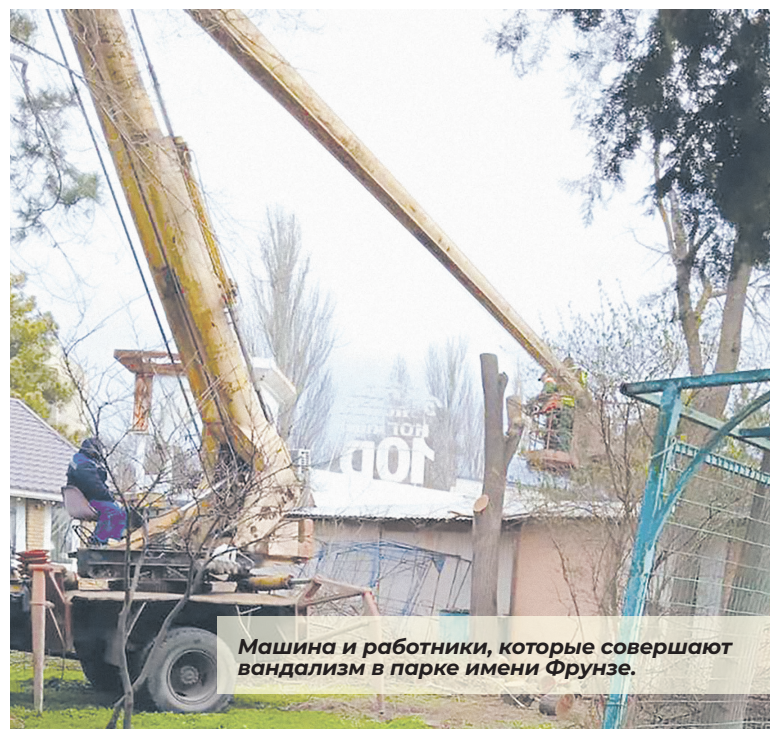
Машина и работники, которые совершают вандализм в парке имени Фрунзе.

Жители Евпатории, конечно, вспомнили о том, что с подачи властей города на территорию парка уже не первый год пытается зайти фирма-инвестор «Забава», вознамерившаяся заменить деревья аттракционами. По свидетельствам очевидцев, стволы срубленных деревьев работники утаскивали и складировали в туалете, арендуемом именно компанией «Забава».