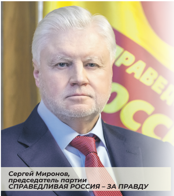
Сергей Миронов, председатель партии СПРАВЕДЛИВАЯ РОССИЯ — ЗА ПРАВДУ