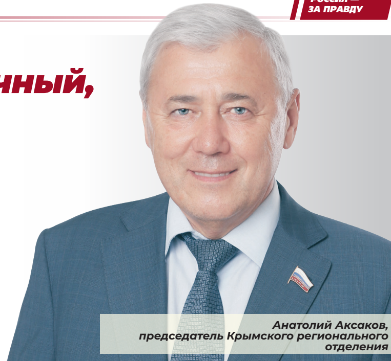
Анатолий Аксаков, председатель Крымского регионального отделения

Уверен, люди в Крыму могут и должны жить лучше. Ведь федеральные инвестиции, о которых много говорят, должны давать мультипликативный эффект. Каждая крым-