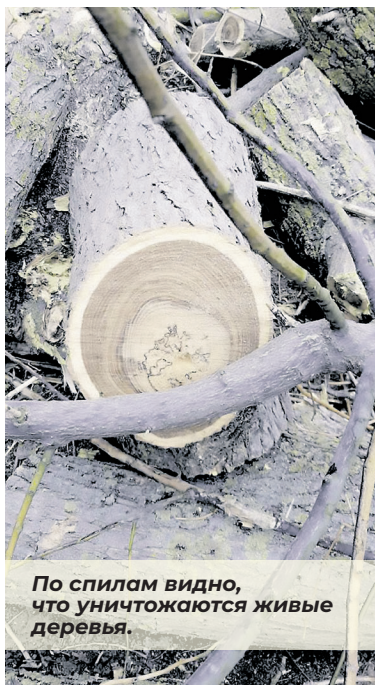
По спилам видно, что уничтожаются живые деревья.

Каково же было удивление и возмущение евпаторийцев в один из мартовских дней, когда какие-то неизвестные люди начали вдруг варварски вырубать деревья