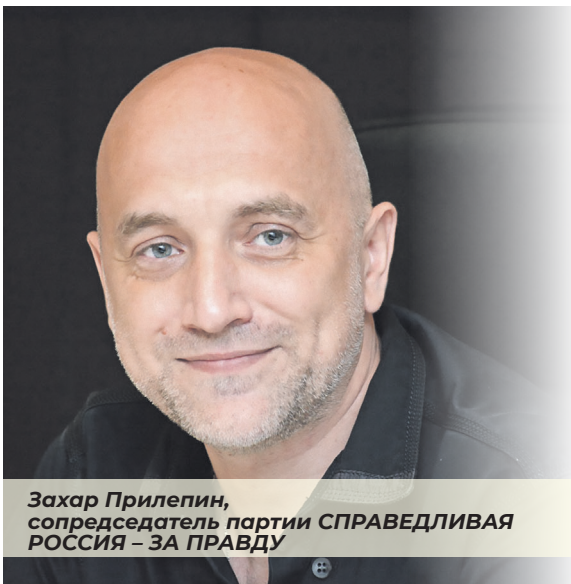
Захар Прилепин, сопредседатель партии СПРАВЕДЛИВАЯ РОССИЯ — ЗА ПРАВДУ

— Семь лет назад, после прошедшего в Крыму референдума, президент России Владимир Путин принял решение о вхождении Крыма и Севастополя в состав РФ. В чем, по-вашему, значение этого события для крымчан и севастопольцев?