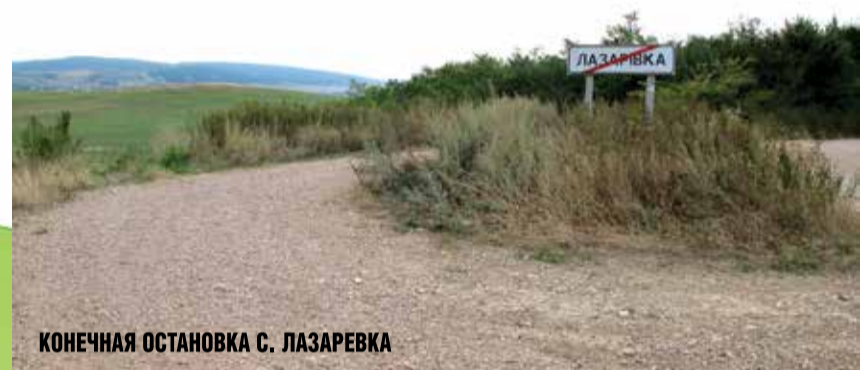
КОНЕЧНАЯ ОСТАНОВКА С. ЛАЗАРЬКА

Фельдшерско-акушерских пунктов, детских садов и домов культуры в селах, как правило, нет. Порой их не найти даже на территории целого сельского совета. В пунктах нет медикаментов, они отапливаются дровами или углем. Живущим в сельской местности жителям даже нет возможности приобрести лекарства. В селах аптек нет. А скорая помощь для всех сел просто роскошь, которую никто позволить себе не может. Здания существующих детских садов и школ нуждаются в косметическом, а часто и капитальном ремонте. В населенных пунктах нет игровых и спортивных площадок. В селе Мирное был некогда спортивный комплекс. В нем работали спортивные секции, занималось очень много детей. На сегодняшний день это просто развалины без окон и дверей. Сельские дети по сути лишены права на достойное детство. Это преступление против нашего же будущего!