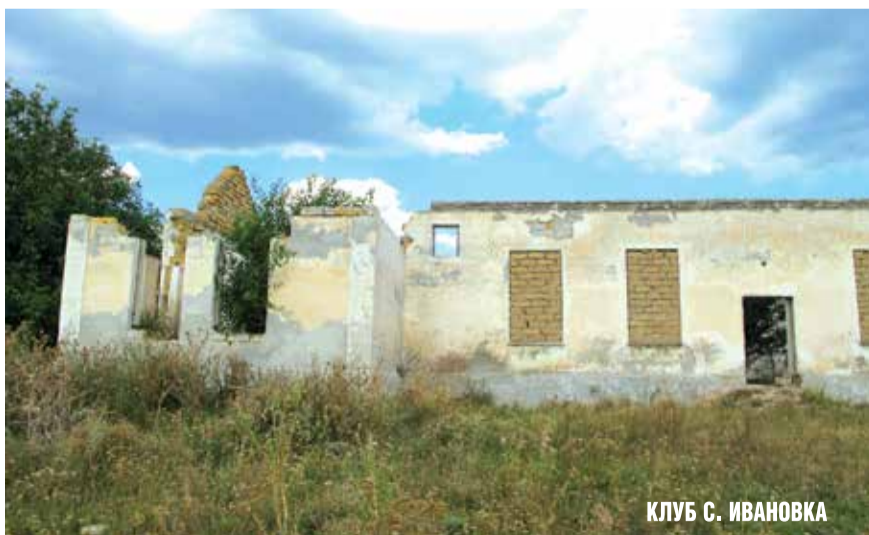
КЛУБ С. ИВАНОВКА

Это проблема всех сельских территорий Республики Крым. Полуостров, который когда-то был настоящей житницей, с развалом СССР лишился почти всех производств. Промышленные и сельскохозяйственные мощности так и не удалось восстановить в полной мере. Крымчане практически лишены возможности найти работу, не покидая родные села и поселки. Ситуацию исправит приток инвестиций и создание прозрачных условий для развития бизнеса. Одно действующее предприятие — это десятки и даже сотни рабочих мест, легальные заработные платы и налоги в местные бюджеты. А ведь именно из налоговых поступлений формируются расходы на социальную защиту, инфраструктуру и благоустройство.