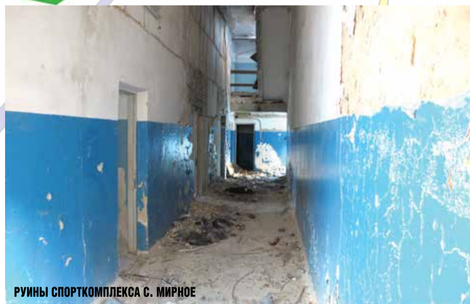
РУИНЫ СПОРТКОМПЛЕКСА С. МИРНОЕ